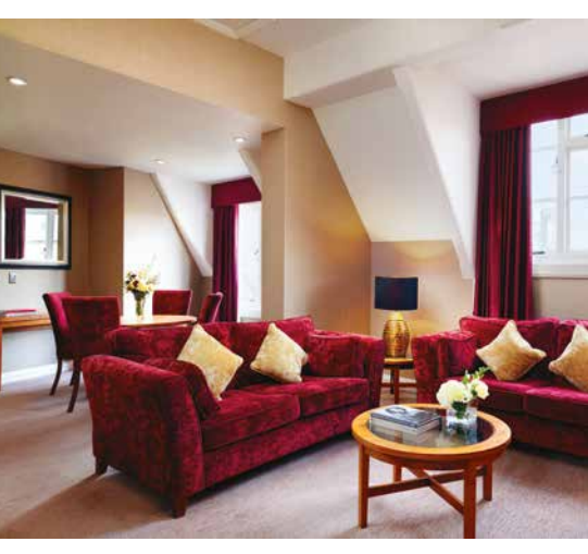
الجناح العلوي بفندق جراند يورك