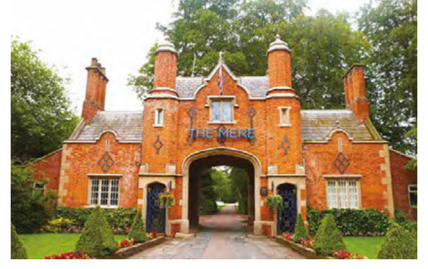
مدخل ذا مير. منتجع للجولف ونادي صحي The Mere entrance, Golf Resort and Spa