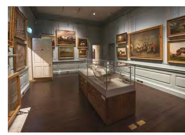
مركز التراث الوطني لسباقات الخيول والفن الرياضي

Her Majesty The Queen opening the National Heritage Centre for Horseracing & Sporting Art