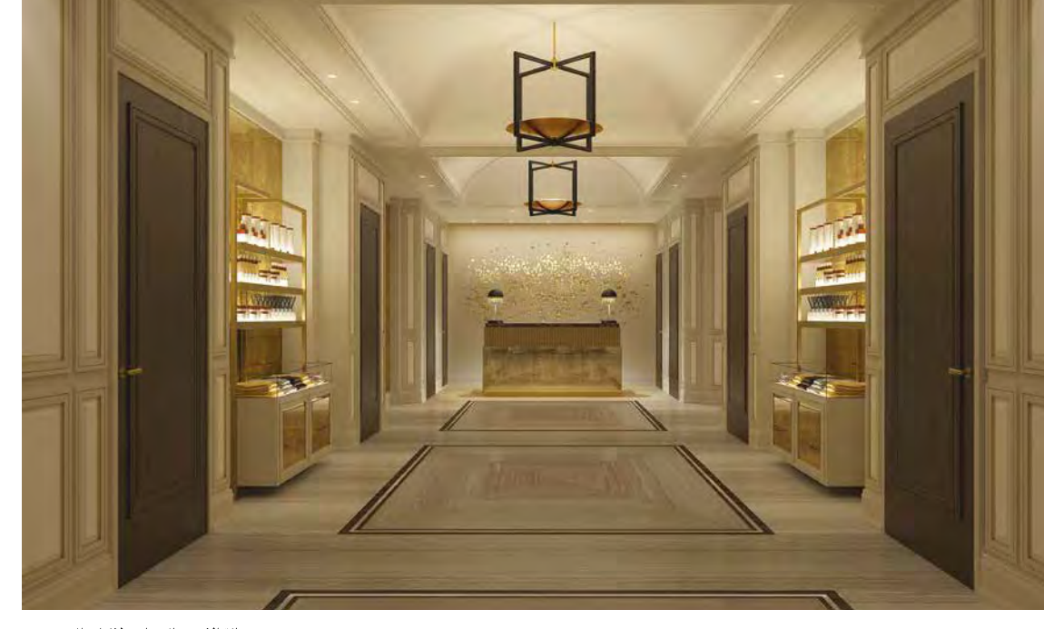
صالة الاستقبال بنادي لانغلي الصحي The Langley Spa reception