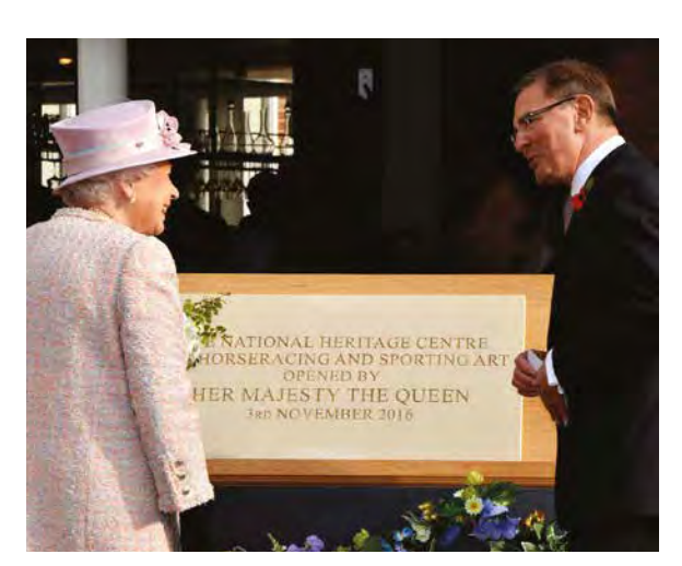
جلالة الملكة تفتتح مركز التراث الوطني لسباقات الخيول والفن الرياضي

Should you want to take a break from racing, why not try cycling, bird watching, spa visits or a visit to the famous colleges in nearby Cambridge.