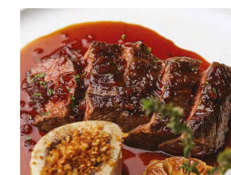
مائدة الطاهي، تشيستر Chef's Table, Chester