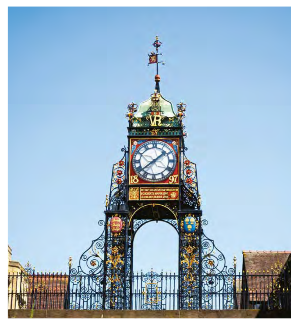
ساعة إيست غيت، تشيستر Eastgate Clock, Chester

If the racing has inspired you to find out more about the horses, you could take a trip to Manor House Stables, one of the most successful flat training yards in the country. Alternatively, travel just an hour over to Manchester and take a VIP tour of the world famous Manchester United Stadium. If timing is on your side you could even catch a match.