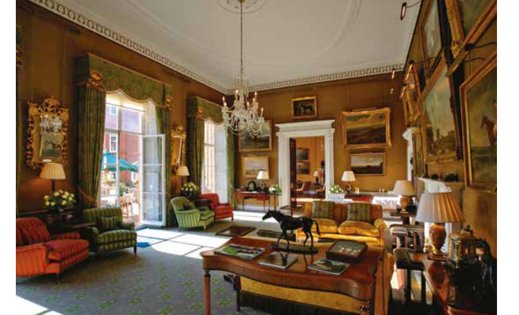
Jockey Club Morning Rooms