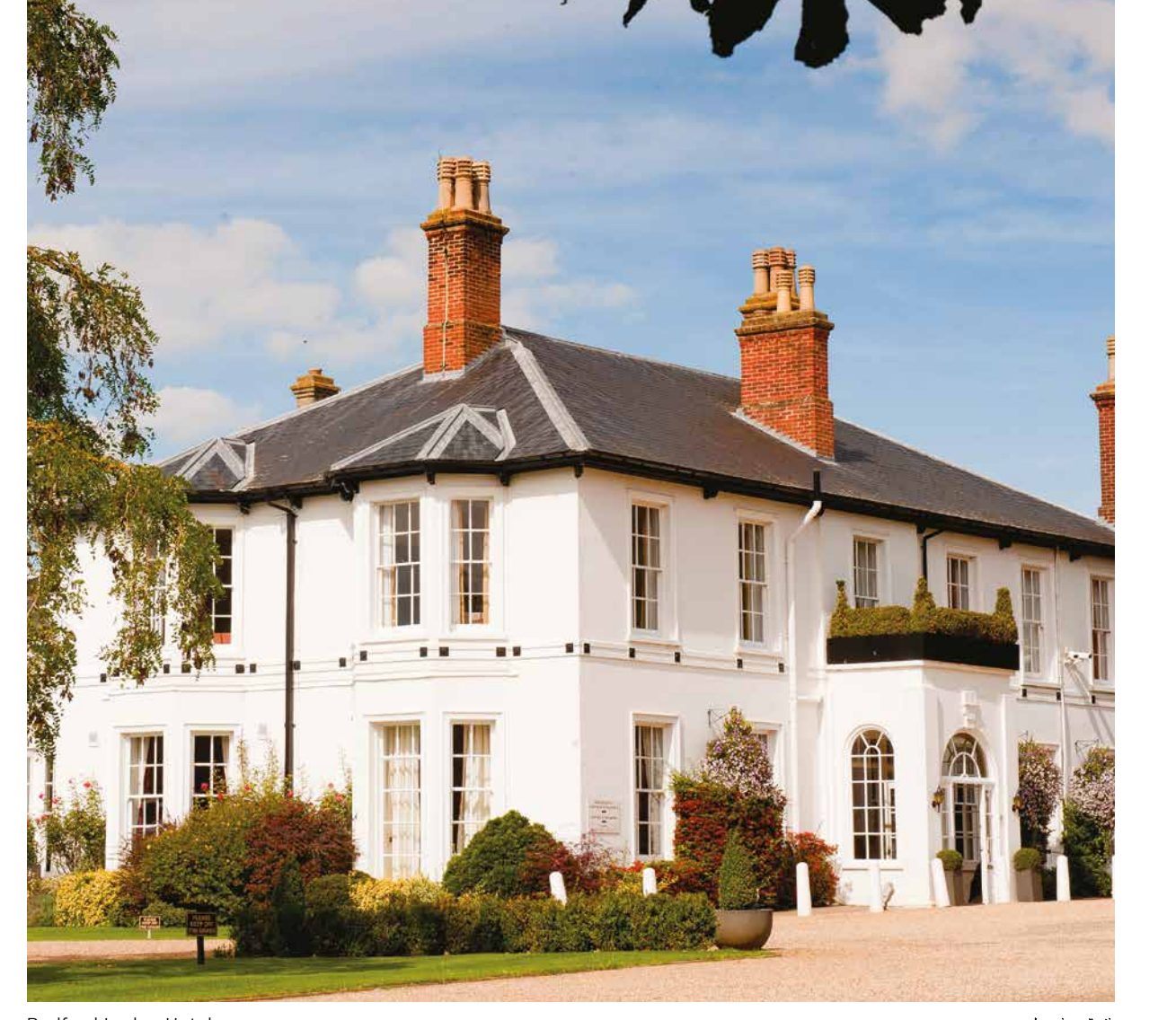
Bedford Lodge Hotel فندق بدفورد لودج

National Heritage Centre for Horseracing & Sporting Art