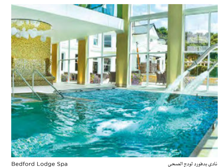
Bedford Lodge Spa