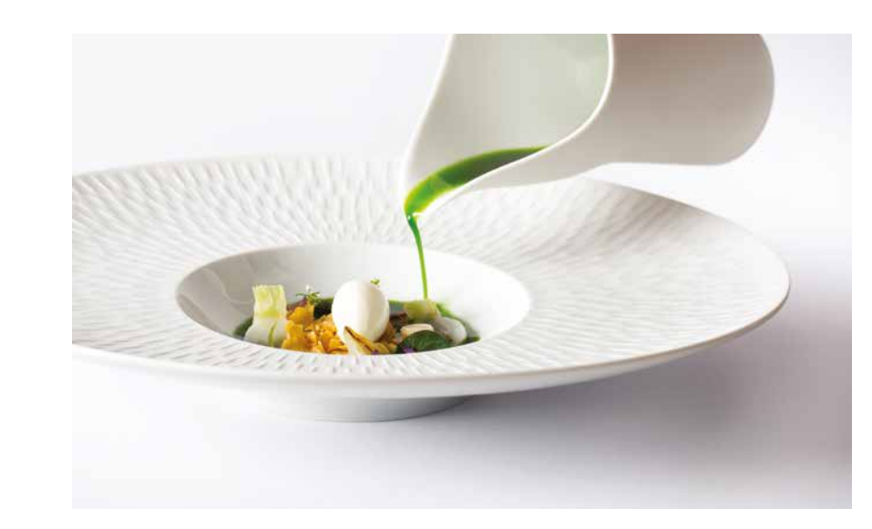
مطعم ذا فات دك، The Fat Duck.